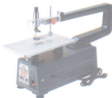
CH-S18, S22 Scroll Saw เครื่องเลื่อย ฉลุ ชิน C.H.