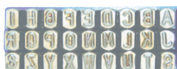
ตัวหนังสือ