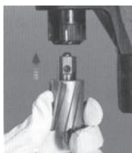
Mounting the Cutter