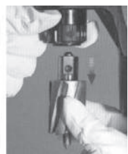
Removing the Cutter